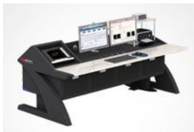
电机试验台典型案例

前端数字化 复杂电磁环境下的高精度测量解决方案 不同功率因数下相位误差对功率测量准确度的影响 幅值对测量准确度的影响？ 准平均值真的可以替代基波有效值吗？